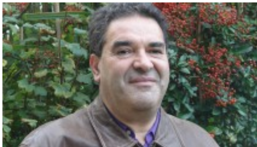
Prof. Dr. Mikhail Katsnelson.